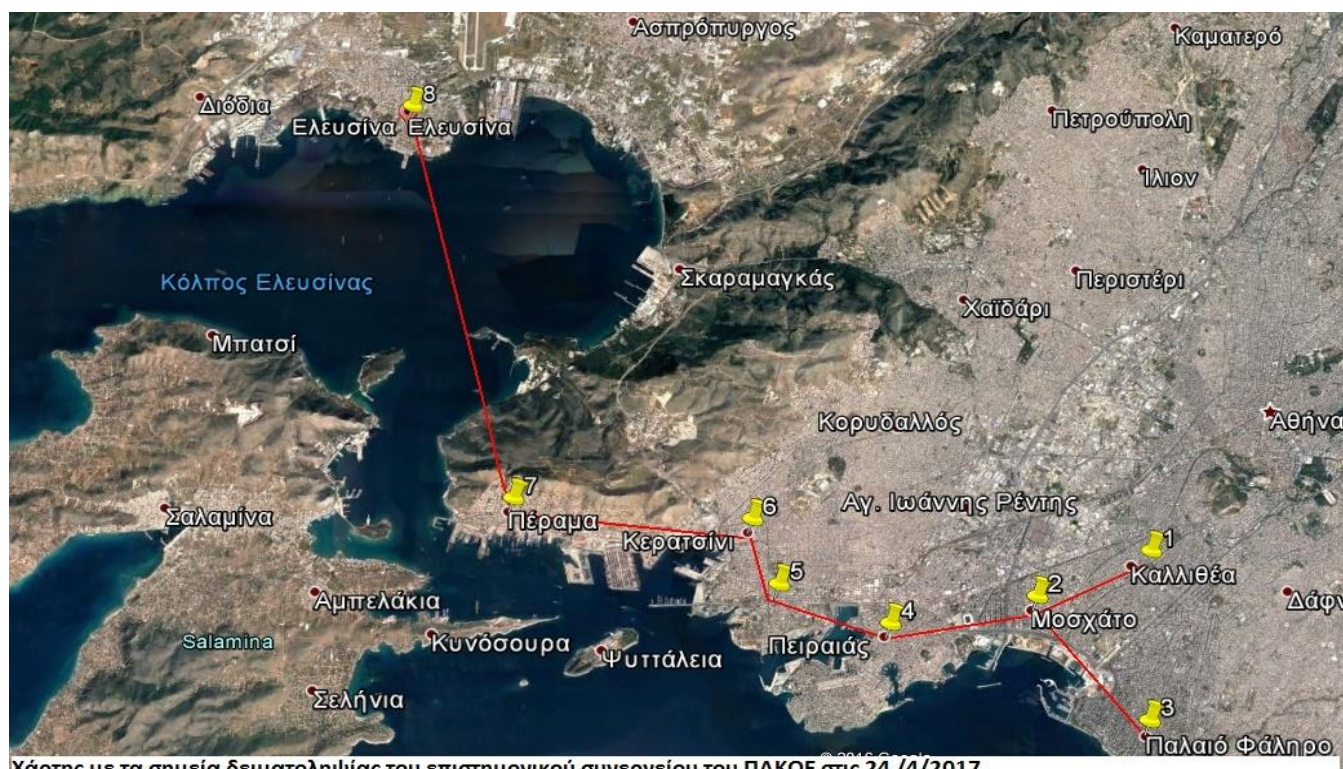
Χάρτης με τα σημεία δειματοληψίας του επιστημονικού συνεδρίου του ΠΑΚΟΕ στις 24 /4/2017.