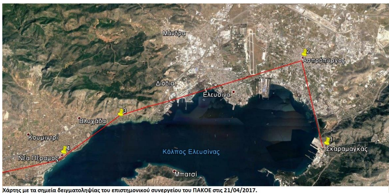
Χάρτης με τα σημεία δειγματοληψίας του επιστημονικού συνεργείου του ΠΑΚΟΕ στις 21/04/2017.