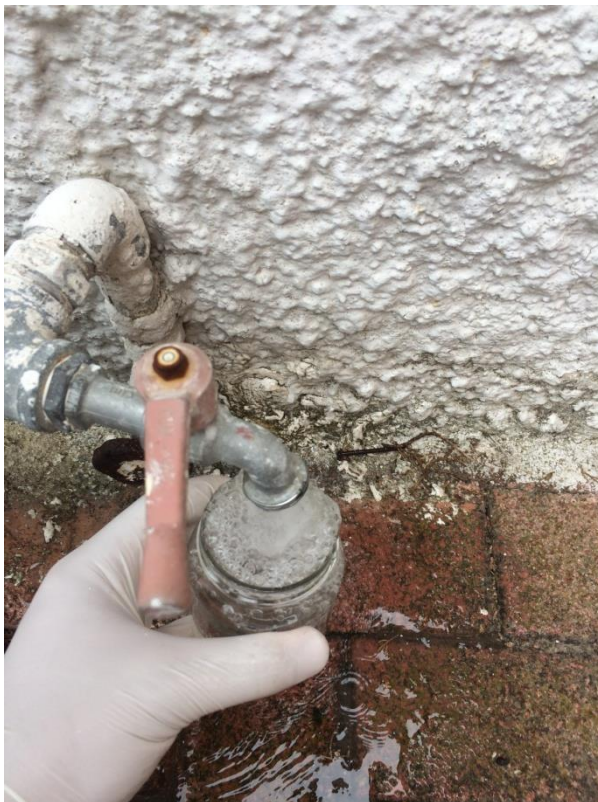
2. Δειγματοληψία από το Ξενοδοχείο ARGO

Ο πίνακας δείχνει τ' αποτελέσματα, την επικινδυνότητα και την ακαταλληλότητα του νερού ανθρώπινης κατανάλωσης σε ποσοστό 32,25 % των δειγμάτων, όπου σύμφωνα με τον Παγκόσμιο Οργανισμό Υγείας (ΠΟΥ), το ποσοστό αυτό δεν πρέπει να ξεπερνά το 2 – 3 %.