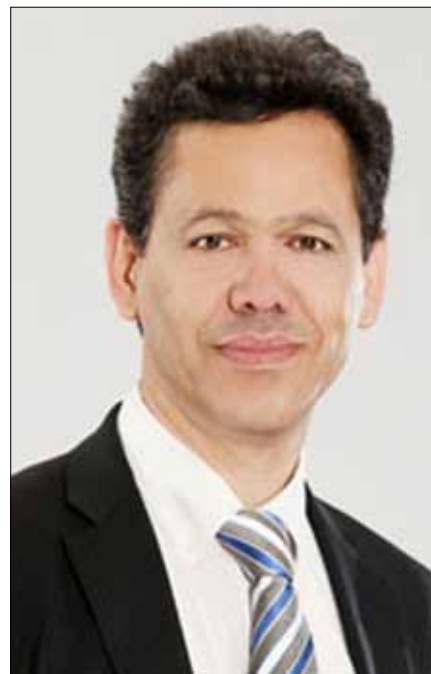
σης, εξαπέλυσε σφοδρή επίθεση στον κ. Γ. Οικονομάκο λέγοντας «Ο κ. Οικο-

νομάκος έχει πολύ καιρό να έλθει στα Δ.Σ. γιατί αθωώθηκε. Τα δικαστήρια αποφάνθηκαν. Αν είχες το θάρρος θα ζητούσες συγγνώμη.