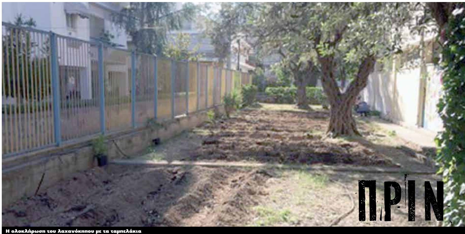
Η ολοκλήρωση του λαχανόκηπου με τα ταμπελάκια