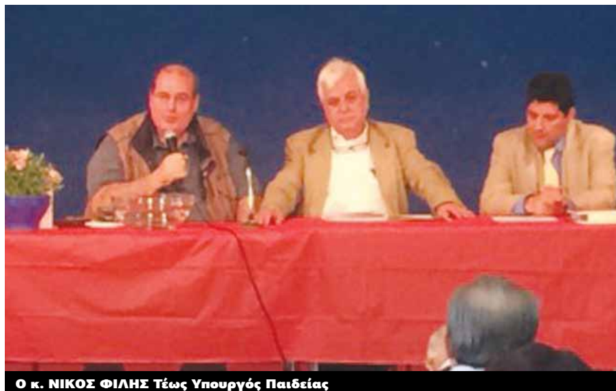
Ο κ. ΝΙΚΟΣ ΦΙΛΗΣ Τέως Υπουργός Παιδείας

Κυρίες και κύριοι, αγαπημένα μας παιδιά, το μέλλον της Ελλάδος. Εγώ με τη σειρά μου θα ήθελα να σας συγχαρώ για αυτή την πρωτοβουλία και τη δραστηριότητα και πραγματικά θα ήθελα να σας δώσει μεγάλη χαρά για να συνεχίσετε. Θα ήθελα να σας παρακαλέσω να πείτε στο φίλο μου και συμπατριώτη μου τον κ. Ζουράρι, και να μη ξεχάσω την καταγωγή μου