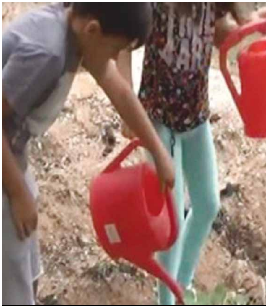
Τα παιδιά ποτίζουν