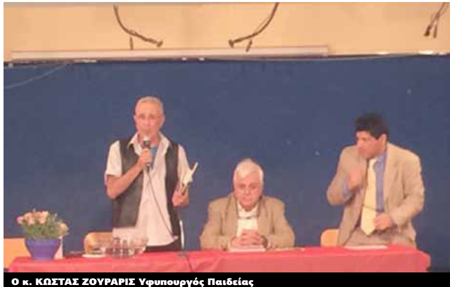
Ο κ. ΚΩΣΤΑΣ ΖΟΥΡΑΡΙΣ Υφυπουργός Παιδείας

σκευμάτων κ. Κώστα Ζουράρι να πει μερικές κουβέντες για την σημερινή ημέρα, η οποία αποτελεί απαρχή της πρωτογενούς παραγωγής για όλους τους Έλληνες. Είναι τραγικό σήμερα στην Ανατολική Αττική να υπάρχουν 350.000 στρέμματα ακαλλιέργητα. Για αυτό το λόγο πιστεύω ότι η πρωτογενής παραγωγή είναι ένα σημαντικό κομμάτι για να προχωρήσει η ζωή μας και να γίνει καλύτερη. Θα παρακαλούσα τον κ. Ζουράρι να έρθει να μας μιλήσει.