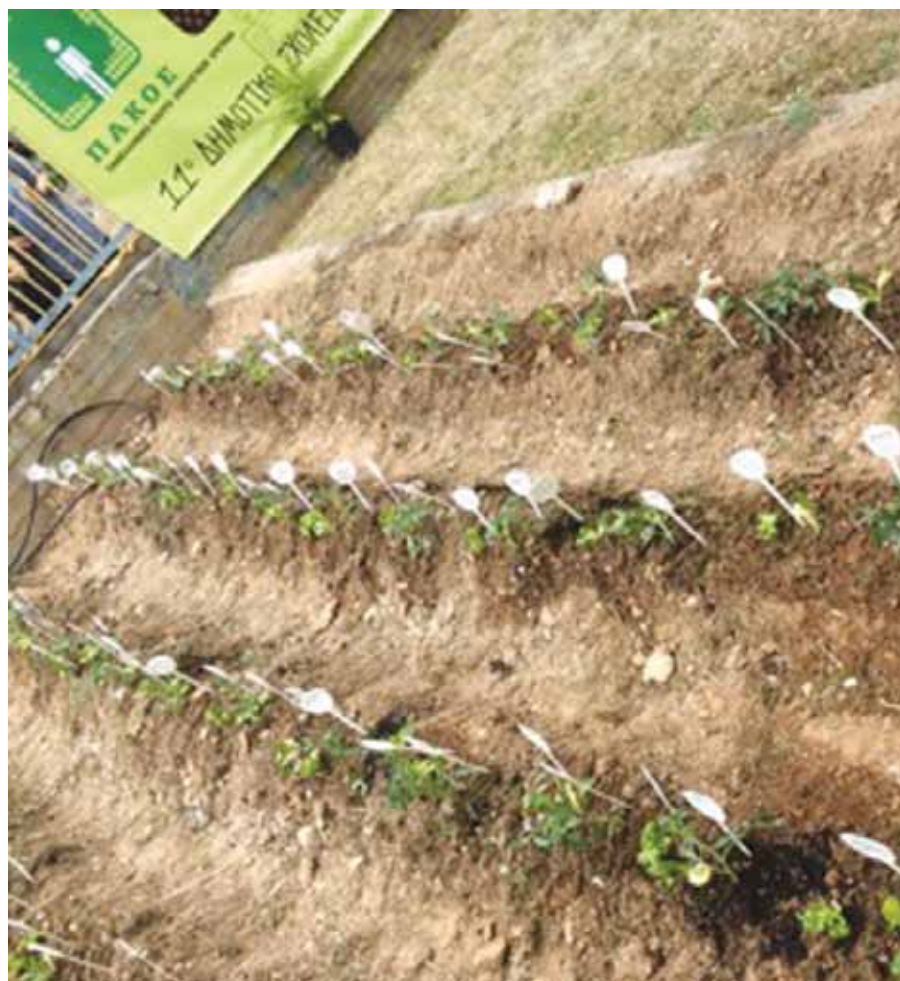
Ο λαχανόκηπος με τα ταμπελάκια