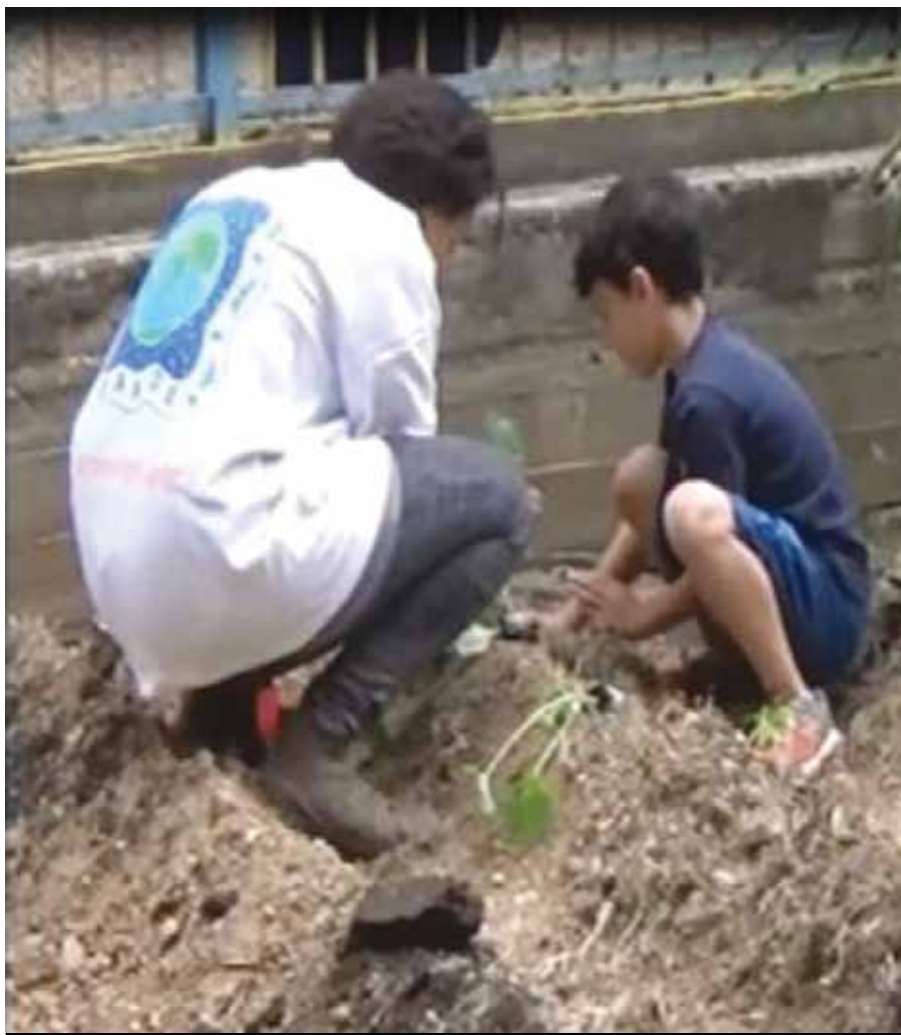
Τα παιδιά φυτεύουν