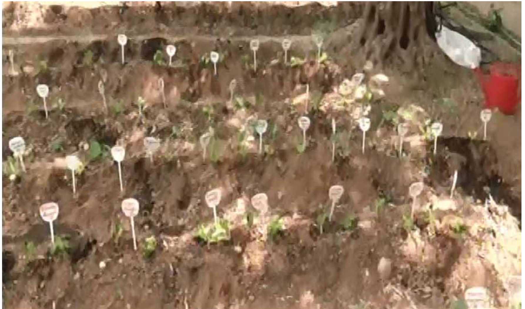
Τα παιδιά και τα φυτά έχουν... ονοματεπώνυμο.